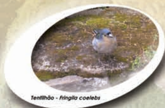
Tentilhão - Fringila coelebs