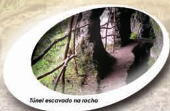
Túnel escavado na rocha