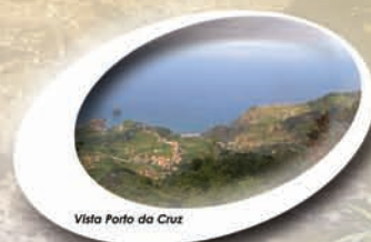
Vista Porto da Cruz